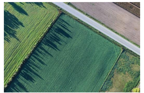
Agrar Standorte überwachen